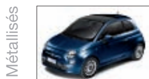
407 - Boogie Blue