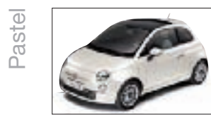
268 - Bossa Nova White