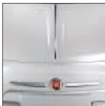
Moulure chromée sur capot. Référence 50901691 Prix TTC (hors pose) : 76 €