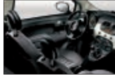
339 - Noir-Ivoire / Noir