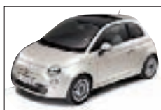
270 - Funk White