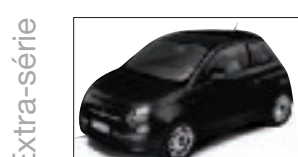
594 - Matt Black*