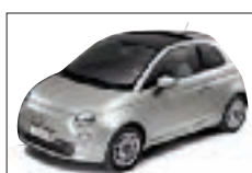
612 - Breakbeat Grey