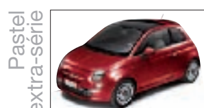
111 - Pasodoble Red