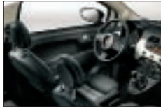
678 - Gris-Noir / Noir