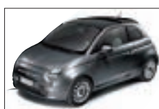
695 - Electroclash Grey