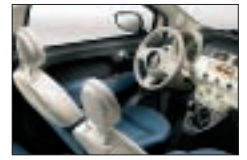
214 - Bleu / Ivoire