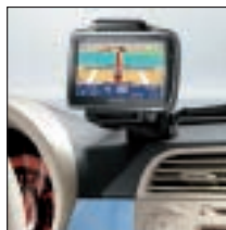
Blue&Me™ TomTom® Référence 71806238. Prix TTC (hors pose) : 368 €