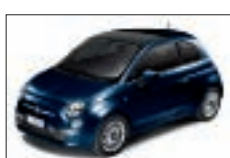
475 - Goth Metal Blue