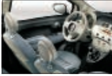
337 - Bleu-Ivoire / Ivoire