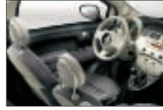
340 - Noir-Ivoire / Ivoire