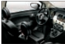
442 - Cuir Poltrona Frau Noir / Noir*