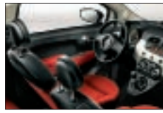
202 - Rouge / Noir