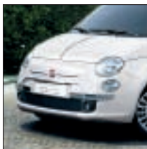
Protection de pare-choc avant chromée. Référence 50901686. Prix TTC (hors pose) : 57 €