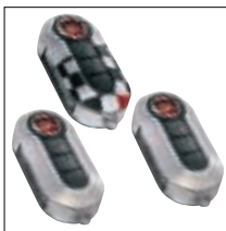
Kit de 3 coques de clé Sport. Référence 50901716. Prix TTC (hors pose) : 54 €