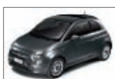
735 - Tech House Grey