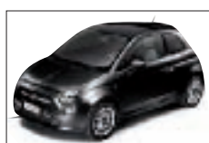
876 - Crossover Black