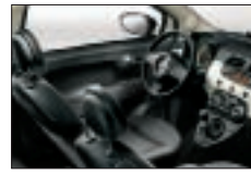
205 - Gris foncé / Noir