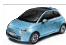
952 - Soul Blue