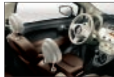
465 - Cuir Poltrona Frau Vintage / Ivoire*