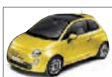
509 - Tropicalia Yellow