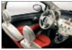
201 - Rouge / Ivoire