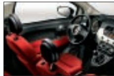
491 - Cuir Poltrona Frau Rouge / Noir*