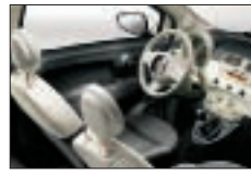
203 - Gris foncé / Ivoire