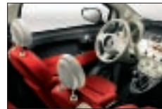
496 - Cuir Poltrona Frau Rouge / Ivoire*