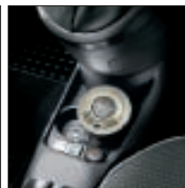
Diffuseur de parfum. Référence 50901870. Prix TTC (hors pose) : 98 €