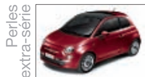
164 - Funk Red