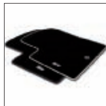
Tapis de sol 3D personnalisable. Référence 51097105. Prix TTC (hors pose) : 67 €