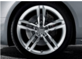
En option : 4 jantes en aluminium coulé style S 5 branches parallèles en étoile, 8,5 J x 19", avec pneus 255/35 R19. Code PRJ