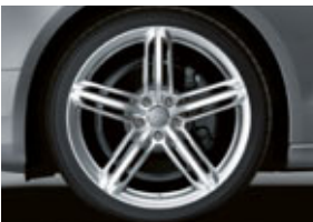
En option : 4 jantes Audi exclusive en aluminium coulé style 5 branches triples, 9 J x 19", avec pneus 255/35 R19. Code PQ6