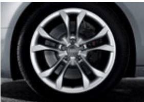
De série : 4 jantes en aluminium coulé style S 5 branches doubles, 8,5 J x 18", avec pneus 245/40 R18.